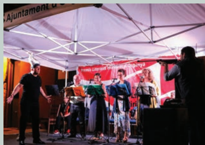
Terra Escrita, amb el Club de Lectura d'Organyà