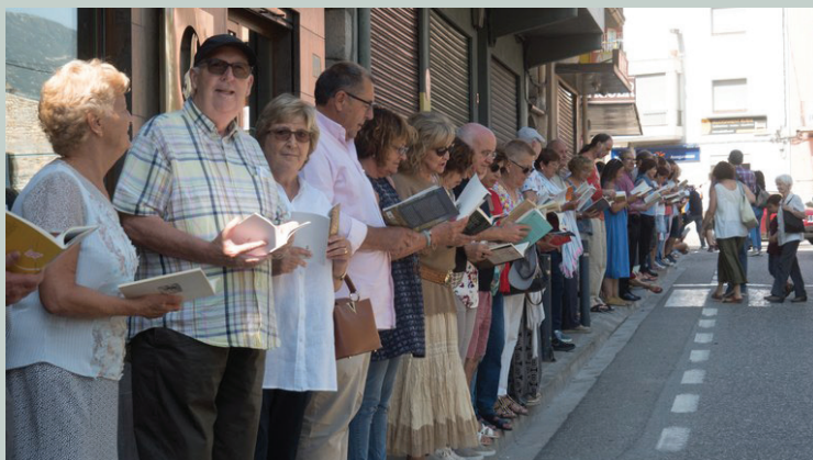
La Carrerada de llibres