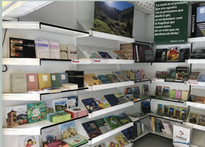
Estand de llibres pirinencs a la Setmana del Llibre en Català de Barcelona.