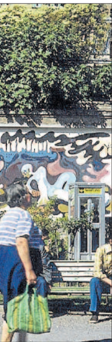
al centre de la imatge