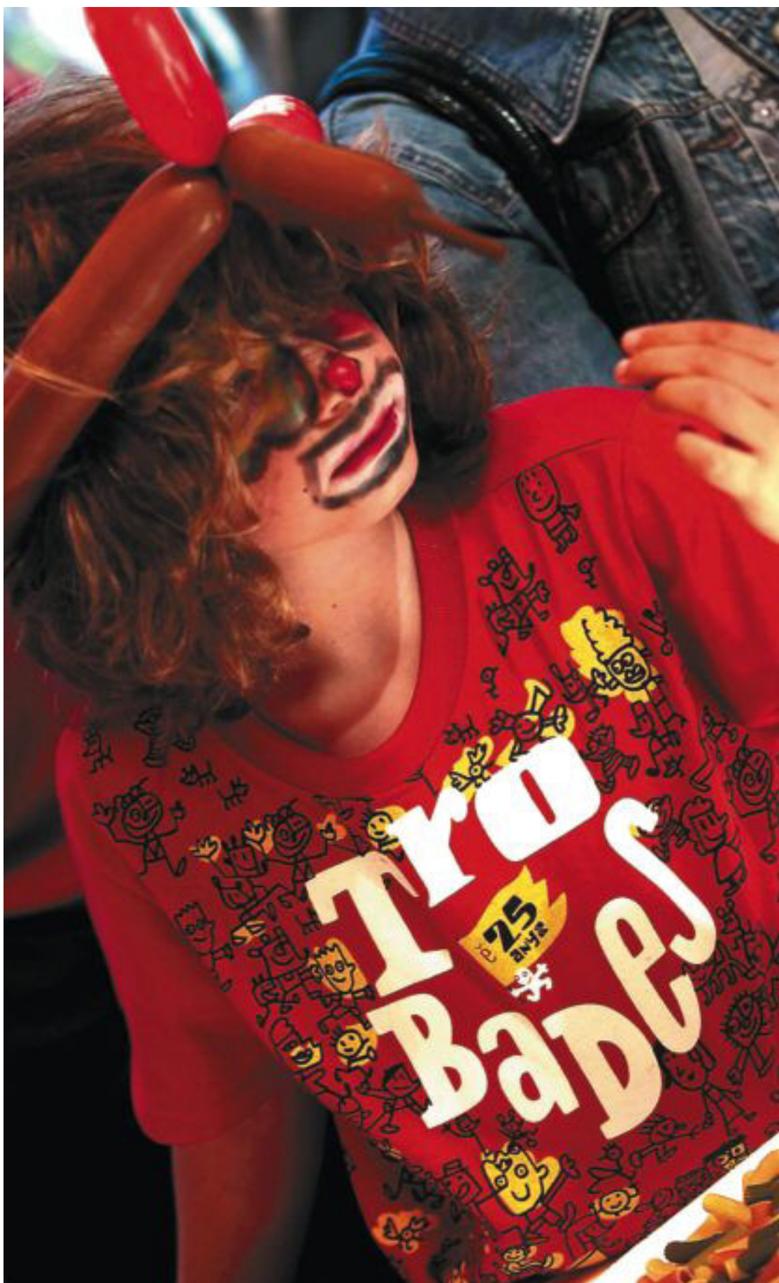
Una xiqueta participant en la trobada d'escola valencianes, dissabte passat, a Atzeneta del Maestrat.