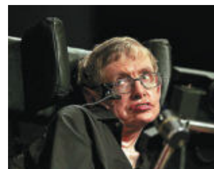
El físic Stephen Hawking.

molta quina, i la posteritat passa factura. També Mies van der Rohe hi hauria col·laborat, si l'hagueren deixat. Li van fer la vida impossible i se'n va anar, fart, als Estats Units. Allí va tindre èxit i ara tots el coneixem, i fins i tot vivim en (dubtoses) imitacions dels seus projectes. També ens podem amemar del seu art esplèndid, tal com ell va voler-lo, un dia lluminós, a Barcelona.