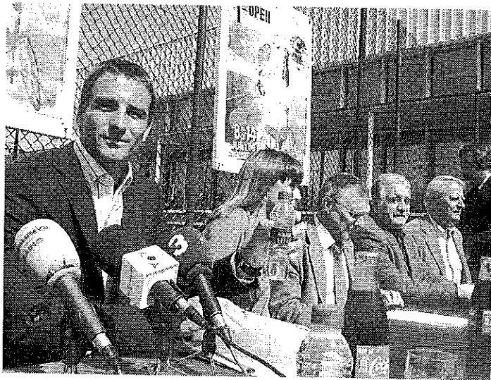
El tennista format a Olot, durant la presentació.