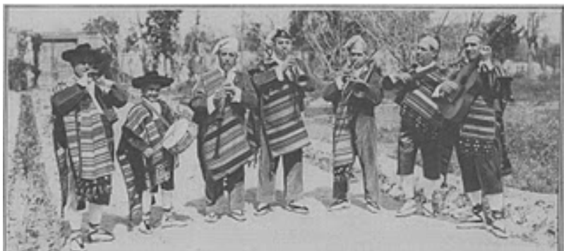
Tabalers i dolçainers preparant Albades

Una dotzena de professors de l'institut s'ha embarcat en un projecte de poesia de tradició oral, en el qual quatre instituts de diferents llocs (de Catalunya, Mallorca, Aragó i València -el nostre-) es reuniran per a fer diferents activitats totes relacionades amb la poesia de tradició oral improvisada.