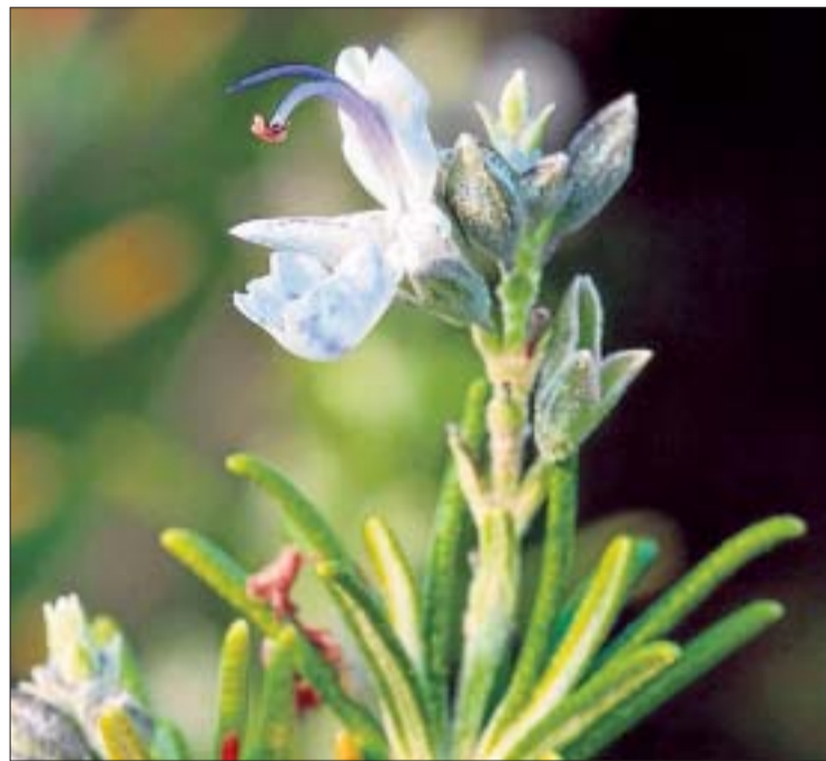
JARDÍ BOTÀNIC DE LA UNIVERSITAT DE VALÈNCIA

✓ Característiques: És una planta de 0,5 a un metre d'alçària (pot arribar fins a dos