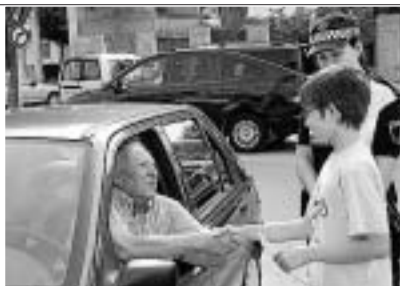
AJUNTAMENT DE L'ALCÚDIA