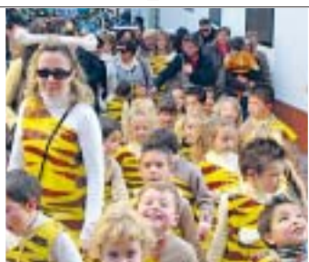
CP PAR JOFRÉ