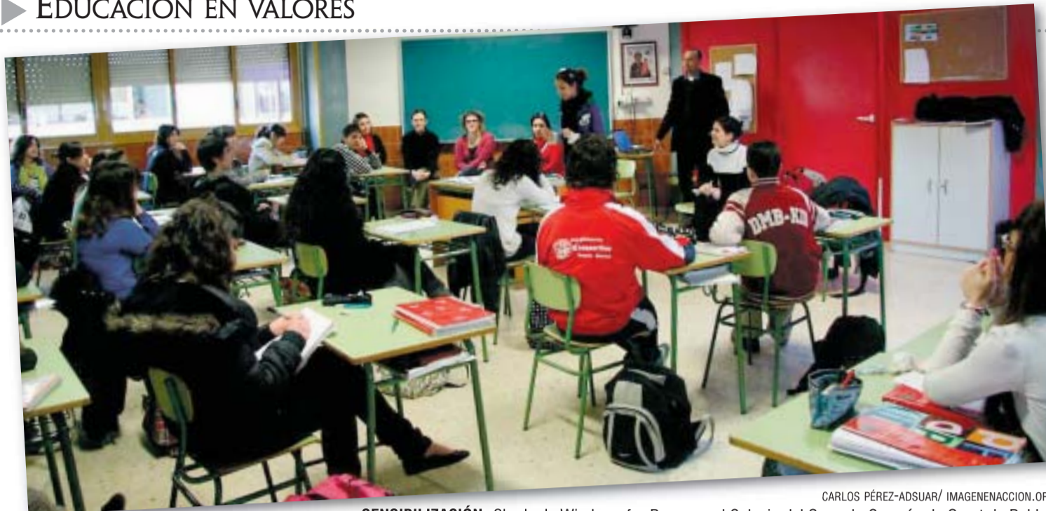
SENSIBILIZACIÓN. Charla de Windows for Peace en el Colegio del Sagrado Corazón de Quart de Poblet.