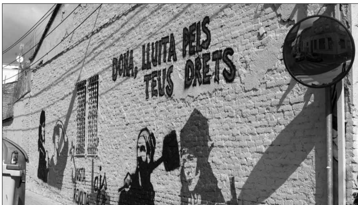
La "perspectiva de gènere" de la reforma laboral no impedeix una major explotació de les dones

Què és el que ens diu aquesta mesura? Quina línia d'actuació defineix? Doncs el que diu és que les dones són un col·lectiu que, per raó del seu sexe, no vol ser contractat pels i les empresàries. Així, per afavorir la seva con-