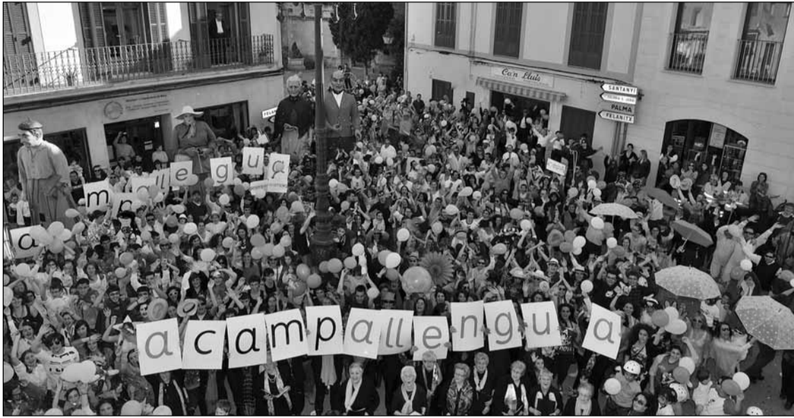
L'Acampallengua és una cita imprescindible de l'agenda dels PPCC en defensa de la llengua