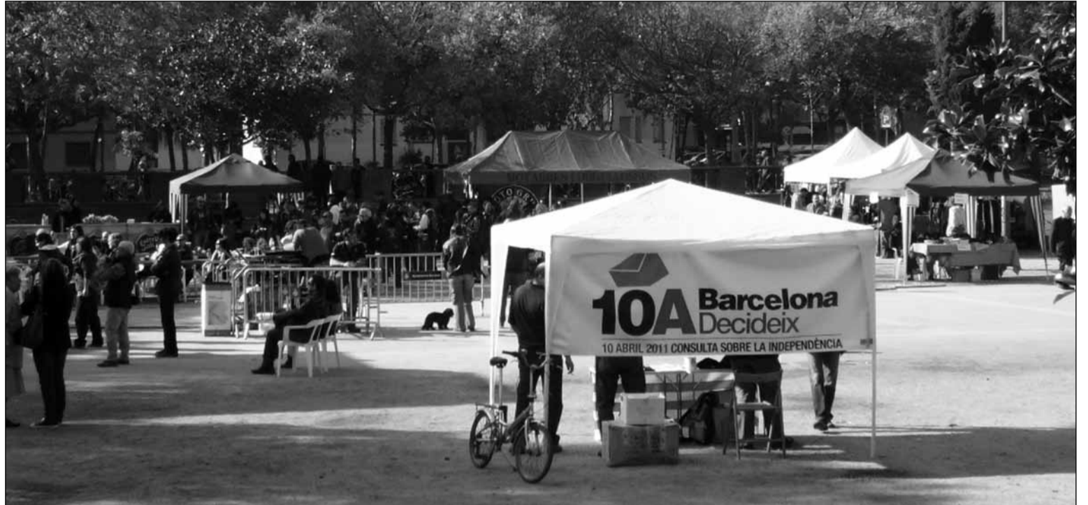
L'èxit de la consulta rau en la capacitat de mobilitzar milers de voluntaris a tots els barris de la ciutat.