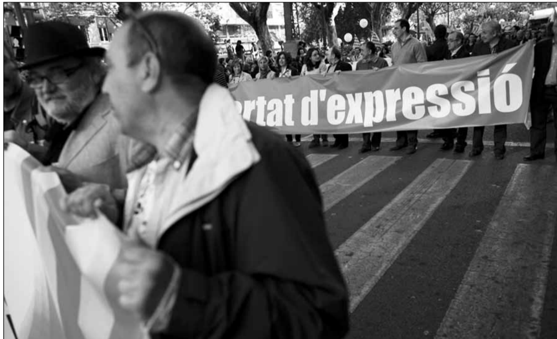
Els carrers de València van viure una de les manifestacions més importants dels últims anys

Es pot dir doncs que la mobilització d'aquest 16 d'abril, una de les més importants en assistència i en repercussió dels darrers anys respon al profund descontentament que experimenten importants sectors de la societat valenciana per la gestió dels governs estatal i autonòmic tant en l'àmbit cultural com en el social i econòmic. Tot això en un context preelectoral en el marc del qual inevitablement apareixen durant la mobilització sigles polítiques o sindicals que no participarien o ho farien amb una presència molt menor, en circumstàncies normals.