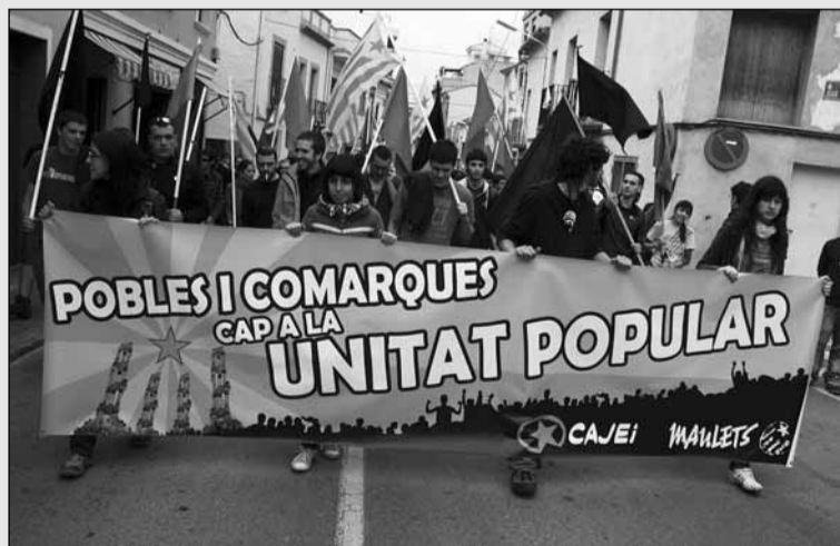
Els joves van recórrer els carrers de Lliria

En arribar a la plaça major de la vila la munió s'acostà a l'església de l'Assumpció i es va desplegar una pancarta amb el text "Ni ducs ni Borbons, alliberem consciències". D'a-