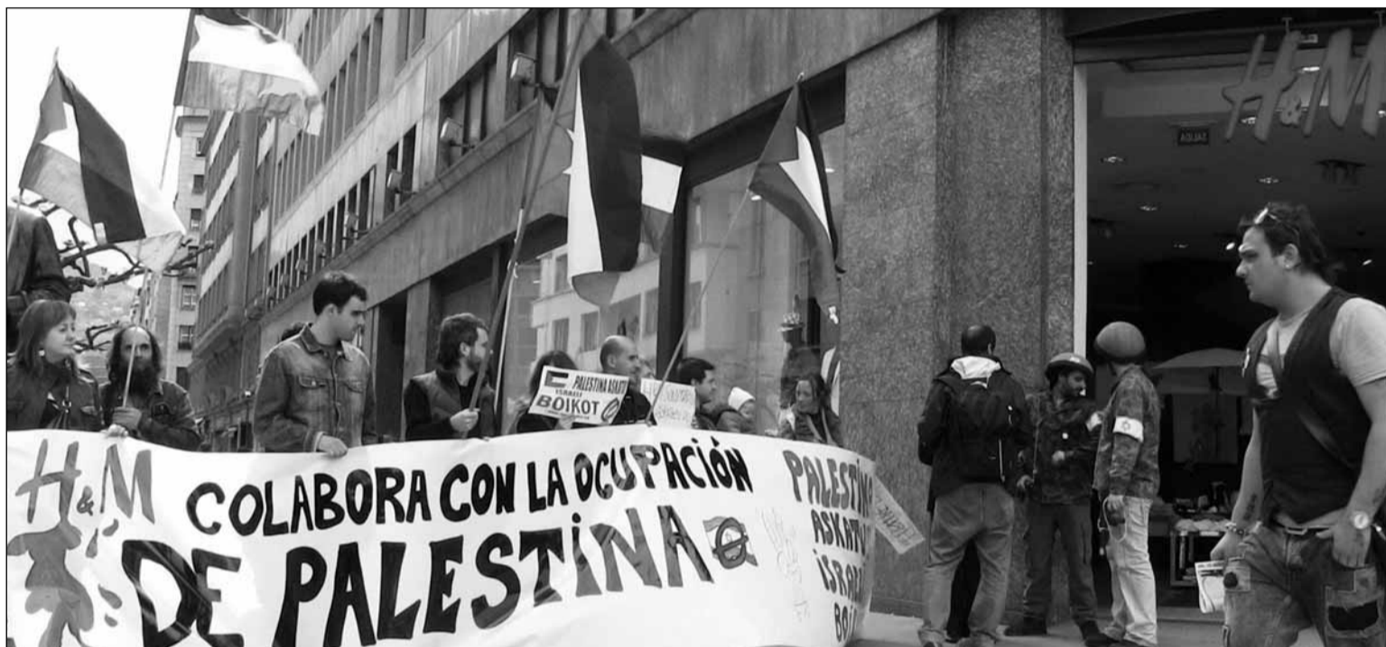
La denúncia de les empreses que col·laboren amb Israel s'ha estès arreu d'Europa

El moviment internacional pel BDS no es posiciona sobre la conveniència de la fórmula dels "dos Estats". El que