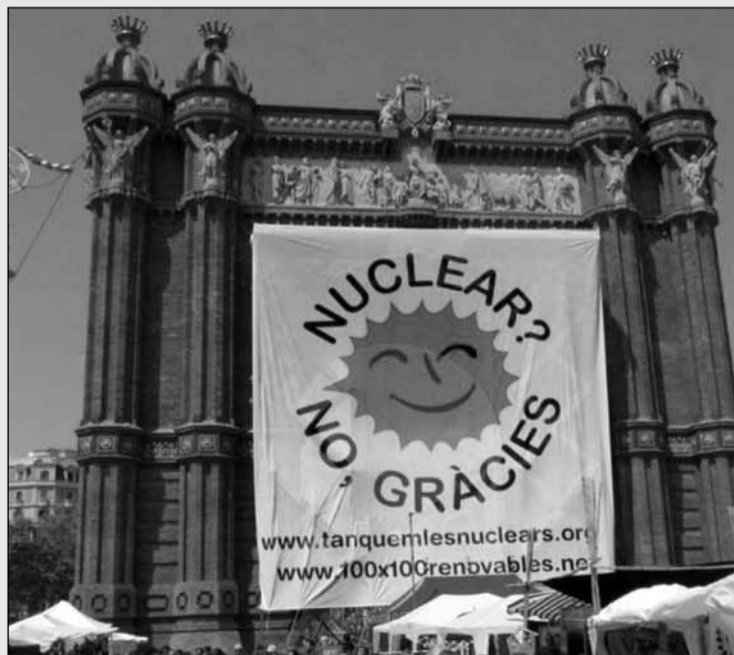
L'accident de Fukushima ha emmudit els defensors de la nuclear

D'altra banda, el Col·lectiu Antinuclear de Barcelona ha organitzat les darreres setmanes dues xarrades