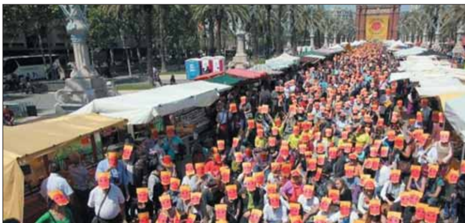
EL Passeig lluís Companys fou escenari d'una gran festa anti-nuclear