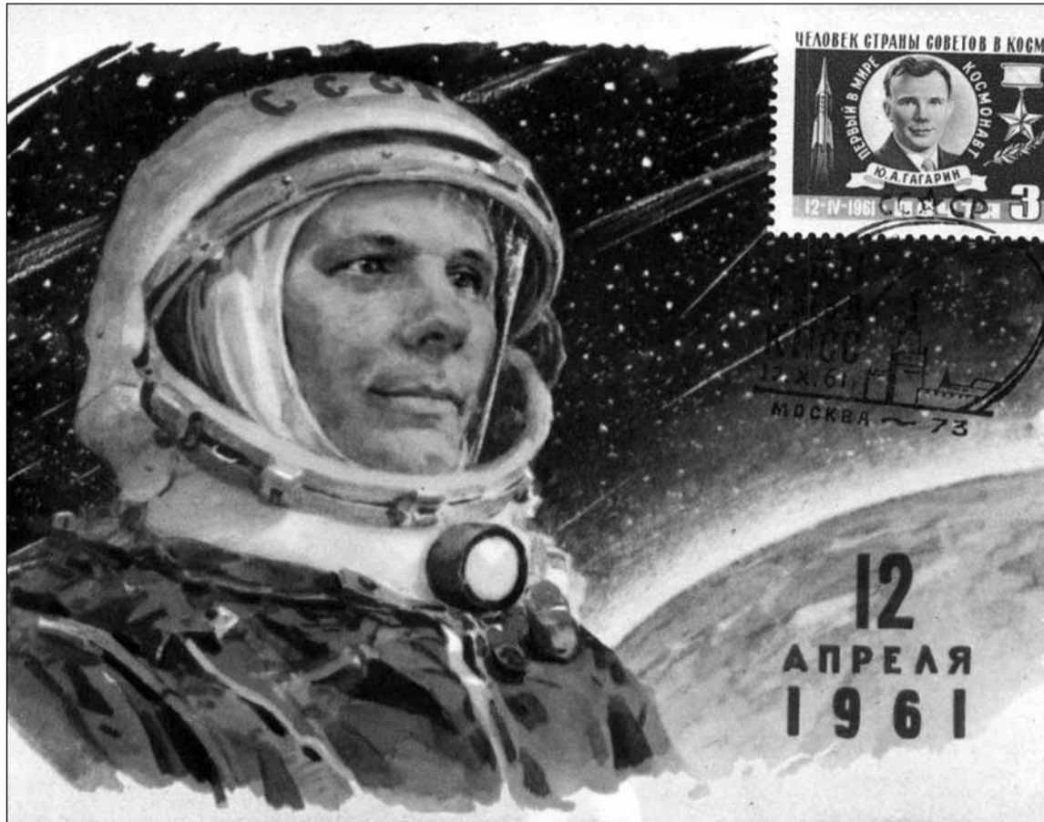
Yuri Gagarín esdevingué un heroi que simbolitzava els èxits tecnològics de l'URSS

Poc després d'arribar a la Lluna els mateixos científics que participaven de la carrera espacial se'n adonaren de les limitacions que existien respecte a la possibilitat d'or-