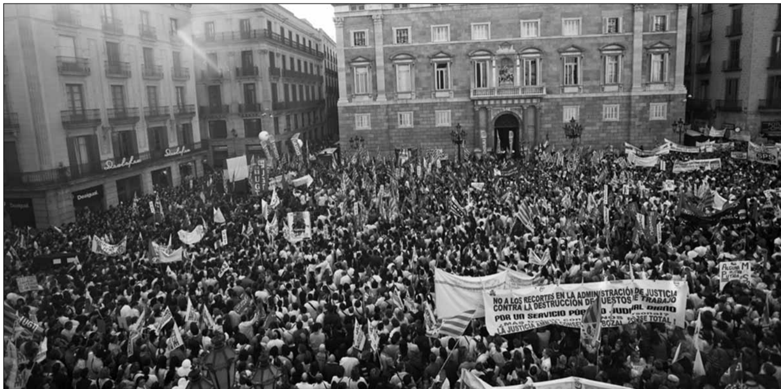
Els manifestants van omplir la plaça Sant Jaume